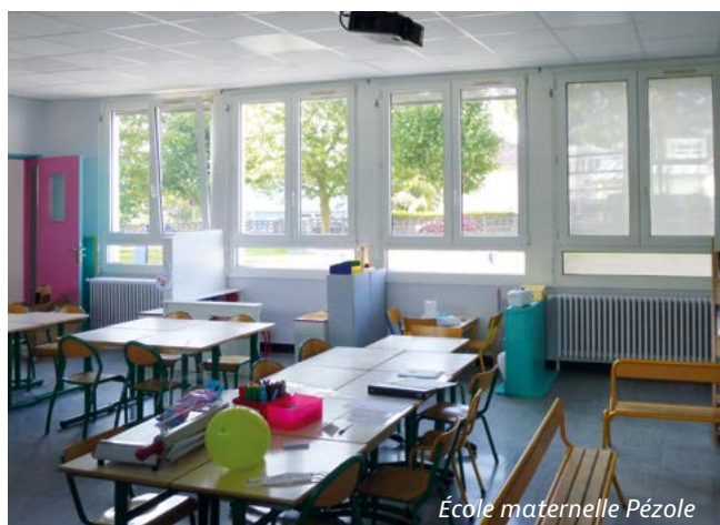
École maternelle Pézole