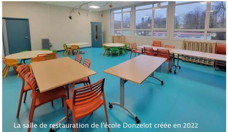
La salle de restauration de l'école Donzelot créée en 2022