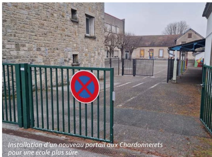
Installation d'un nouveau portail aux Chardonnerets pour une école plus sûre