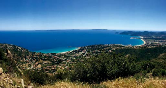
Le Lavandou vue mer panoramique

Cette année, dans le cadre du programme "Seniors en Vacances", le CCAS emmène nos seniors à La Londe-Les Maures, dans le Var, du 22 au 29 juin.