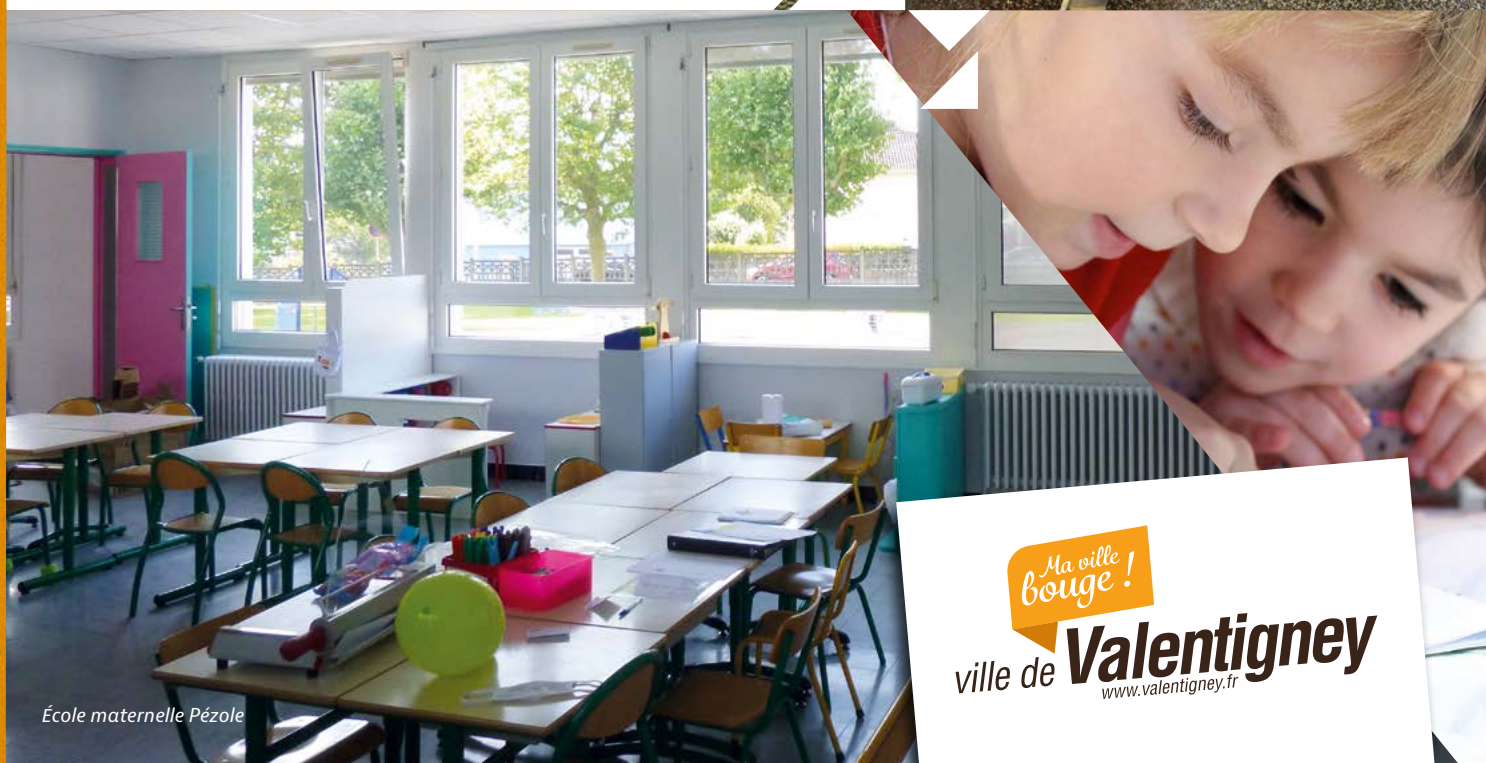
École maternelle Pézole

Ma ville ! bouge ! ville de Valentigney www.valentigney.fr