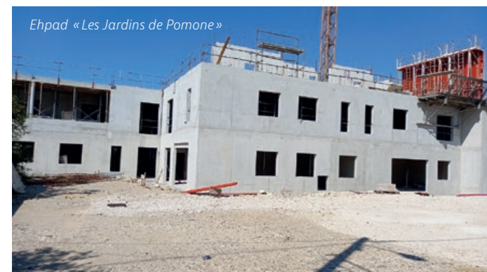
Ehpad « Les Jardins de Pomone »

Du côté du futur Ehpad, « Les Jardins de Pomone », les travaux, lancés au 1 er trimestre 2024 vont aussi bon train. La structure ouvrira ses portes au cours du 1 er semestre 2026.