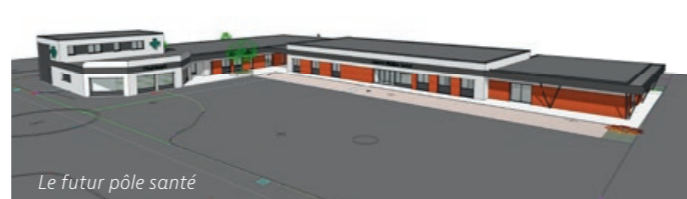
Le futur pôle santé