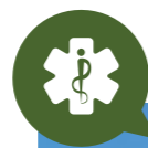
Le futur pôle santé