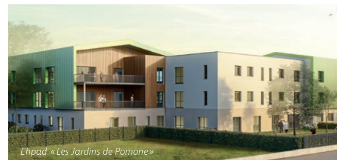
Ehpad « Les Jardins de Pomone »