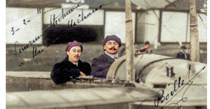
Jules Goux et Georges Boillot