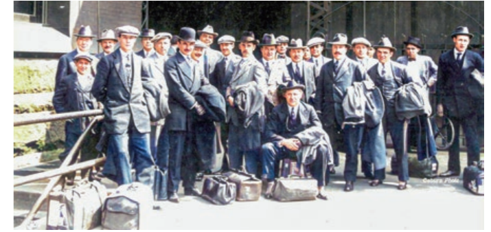
Arrivée à Indianapolis, 1914